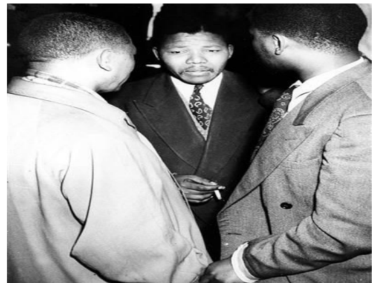
Sus años en prisión