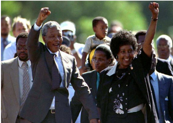
Nelson Mandela Presidente