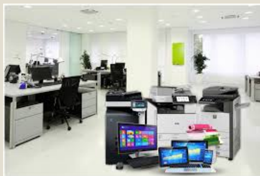
Equipos incl. computadoras: U$S 5,5 mil millones 6,1%)