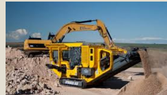
Maq.p/mezclar, triturar, quebrantar: U$S 10,2 millones