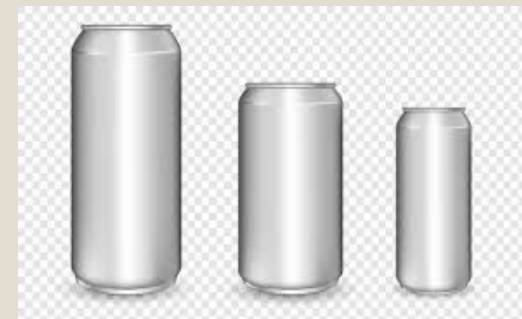
Latas de aluminio cap.linf.500ml.:U$S 6 millones