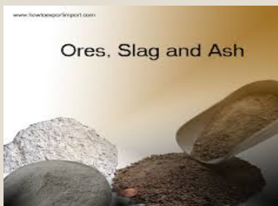
Minerales, escoria y cenizas: U$S 13,1 mil millones 14,5%)