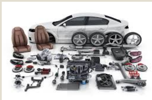
Demás partes de motores: U$S 21,5 millones