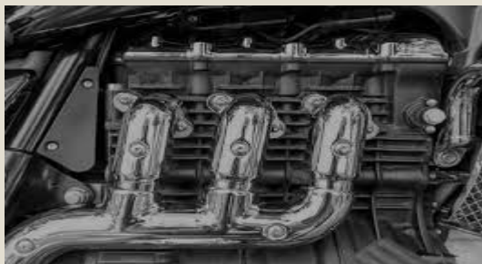
Componentes originales para automóviles: U$S 42,3 millones