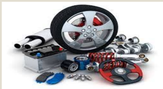
Partes y accesorios automóviles: U$S 7,2 millones