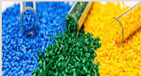
Plásticos, art.plásticos: U$S 2,8 mil millones (2,8%)