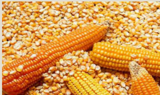
Maíz: U$S 85,3 millones