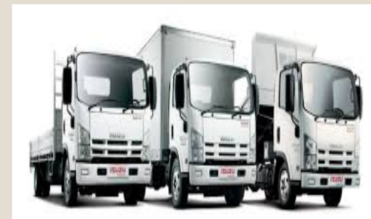
Vehículos de transporte de carga max 5 ton: U$S 68,5 millones