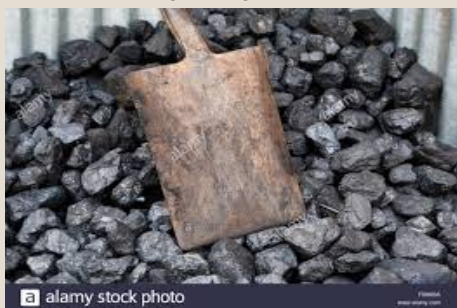
Carbón: U$S 9,1 mil millones (10,7%)