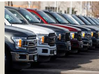
Vehículos: U$S 11,4 mil millones (12,7%)