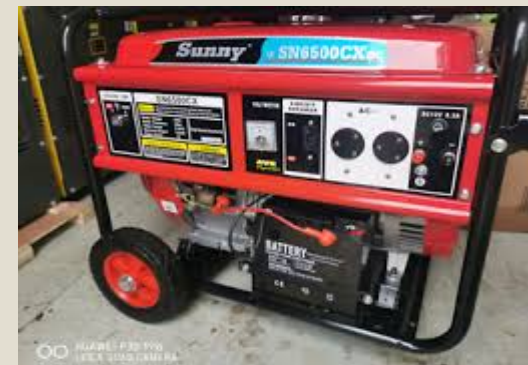
Maquinarias eléctricas: U$S 8,6 mil millones (9,7%)