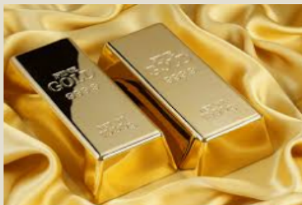
Metales y piedras preciosas : U$S 15,3 mil millones (17%)