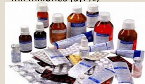
Farmacéuticos: U$S 2,4 mil millones (2,7%)