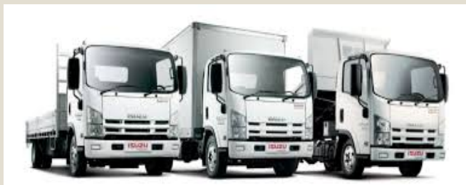
Vehículos: U$S 7 mil millones (8%)