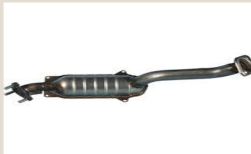
Catalizadores para automóviles: U$S 15 millones