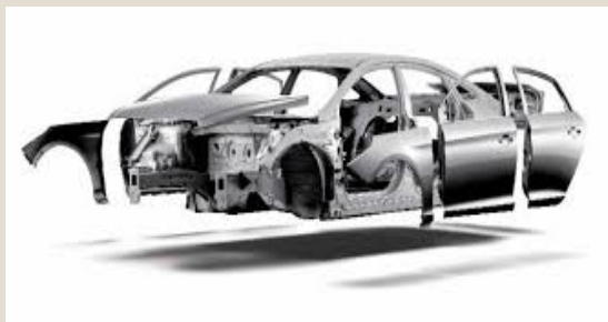
Partes para carrocerías: U$S 8,2 millones