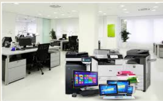
Equipos incl.computadoras : U$S 11,2 mil millones 12,7%)