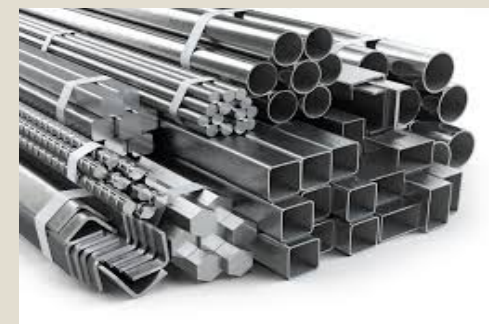
Hierro y acero: U$S 5,4 mil millones (6%)