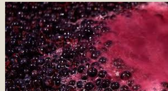
Jugo de uva (incluido el mosto): U$S 25 millones