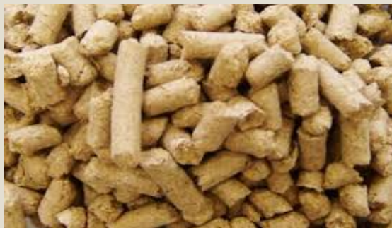
Harina y pellets extracción aceite de soja : U$S 130,3 millones