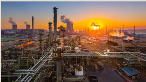
Combustibles : U$S 14,8 mil millones (16,8%)