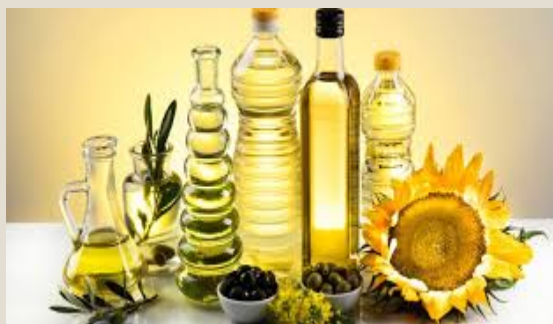
Aceite de girasol en bruto: U$S 36,7 millones